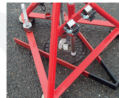
Bei lockeren Einbautöpfen oder extrem feststehenden Kappen, die Distanzscherer als Niederhalter unterlegen.