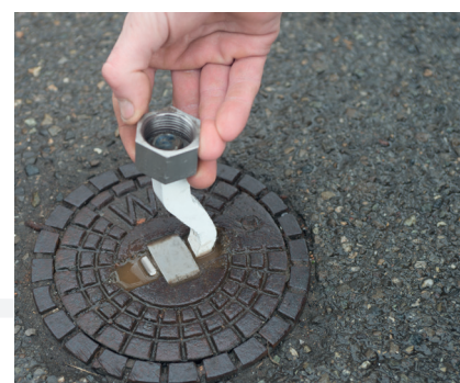
Den Haken in den Ziehsteg einsetzen. Gegebenenfalls mit dem Hammer nachhelfen. Das geschlossene Ende des Hakens zeigt dabei in Richtung Kappensicherung.