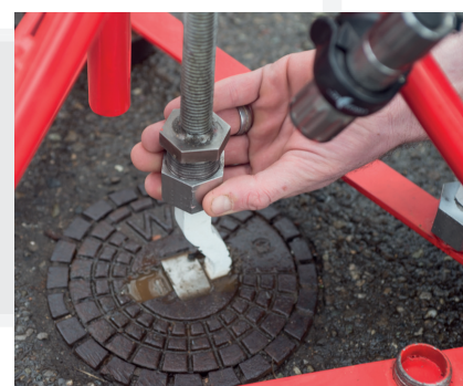
CAPLIFT aufsetzen und die Gewindesteindel auf den Haken aufschrauben.