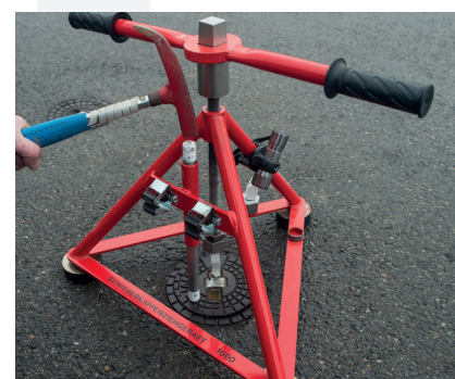
Ein kurzer Schlag auf die Schlagstange reicht meist aus, um auch feststehende Kappen zu lösen.