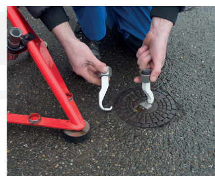
Den passenden Haken für die zu öffnende Kappe auswählen