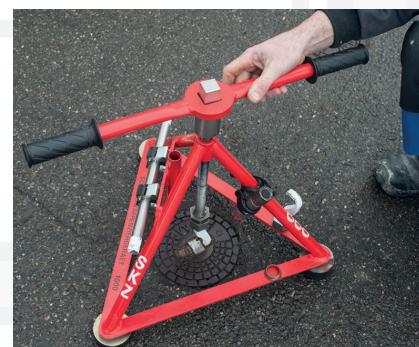
Gerätedrehschlüssel aufsetzen und die Straßenkappe durch langsames Linksdrehen lösen.