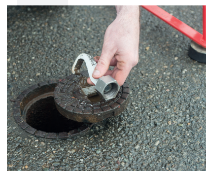
Die Kappe ist offen. Den Haken wieder von der Spindel trennen und auf die vorgesehenen Gewindestummel am CAPLIFT aufsetzen.