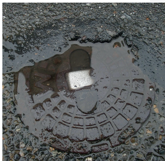
Eingeteerte Straßenkappen. Nicht sachgemäße Verarbeitung/ Reparatur des Straßenbelags.

Eigentlich haben Sie „nur kurz“ die Kappe öffnen wollen - jetzt sind Sie bereits eine viertel Stunde damit beschäftigt. Die Krönung dabei ist die Wasserpfütze, die Sie während Ihrer Versuche mit dem Hammer kontinuierlich mit Schmutzwasser „kühlt“. Ganz abgesehen von den Gussteilen, die absplittern können und Sie nicht selten im Gesicht treffen.