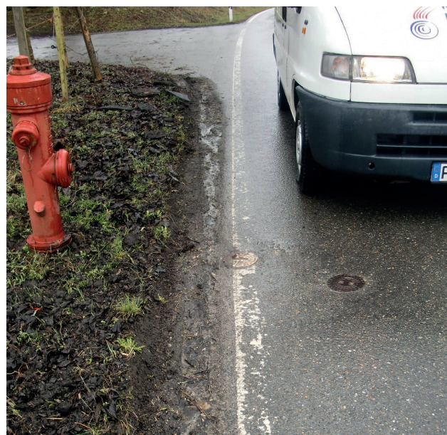
Straßenkappen in Bereich der Fahrspur. Festgefahren und oft ohne Zerstörung kaum zu lösen.

Jeder der vom Fach ist, kennt das Problem: feststehende Straßenkappen, die sich mit dem Kappenhammer einfach nicht öffnen lassen.