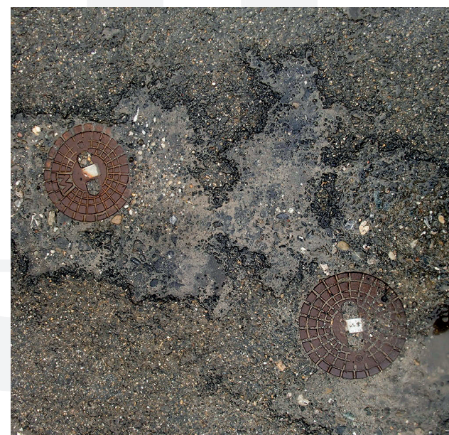
Unebene Oberflächen. Durch Frost und Schmutz und Korrosion feststehende Straßenkappen.

Verwenden Sie CAPLIFT - Sie können mit Ihrer Zeit besseres anfangen, als mit dem Hammer auf feststehende Kappen einzuschlagen.