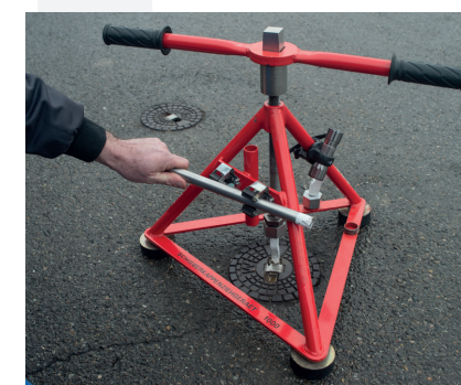
Falls notwendig die Schlagstange aus der Halterung nehmen und in das Führungsrohr einsetzen.